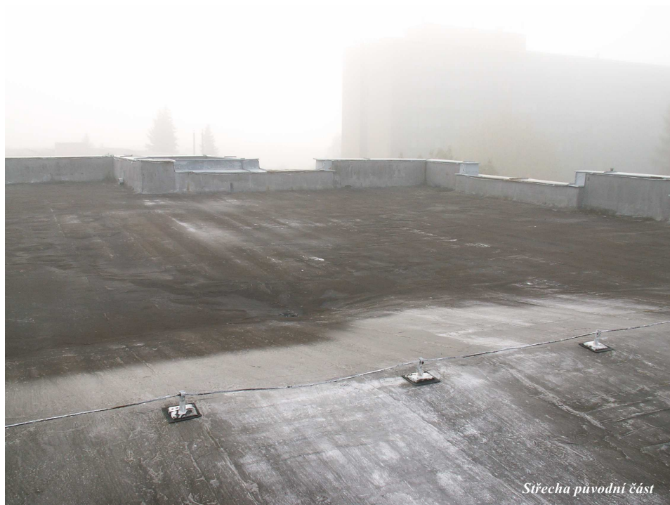
Střecha původní část