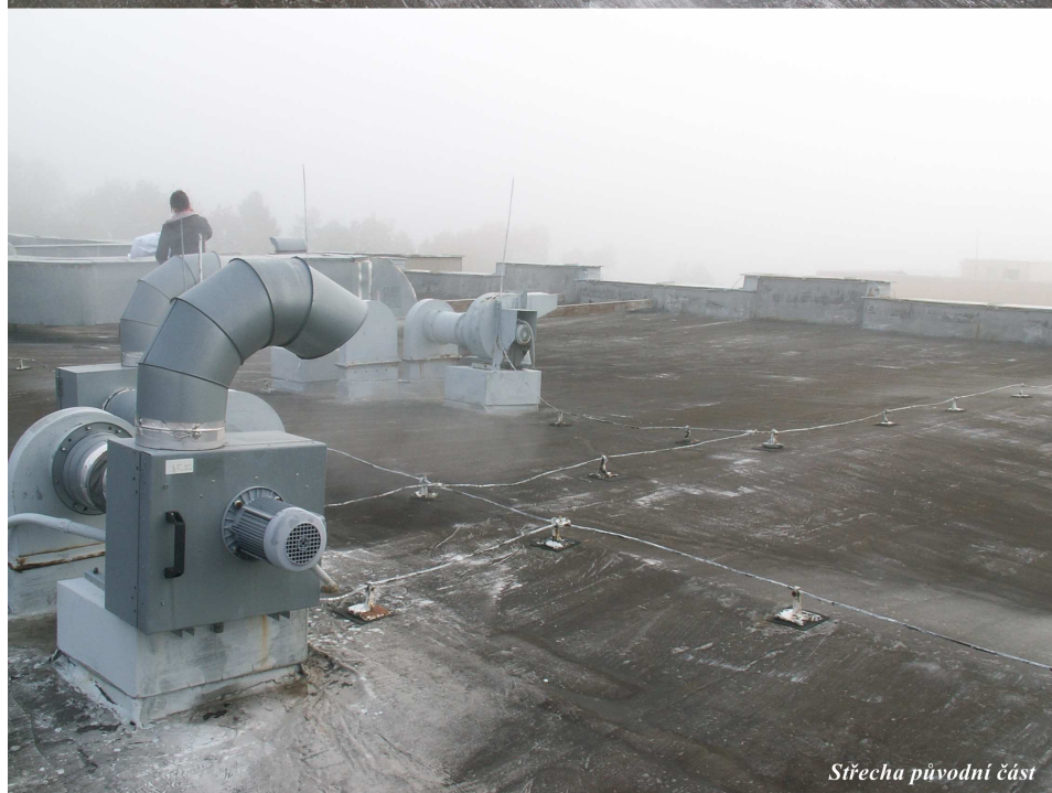
Střecha původní část