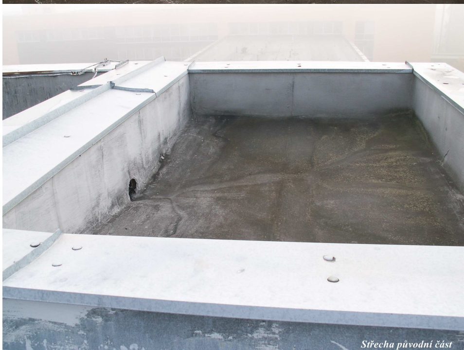
Střecha původní část