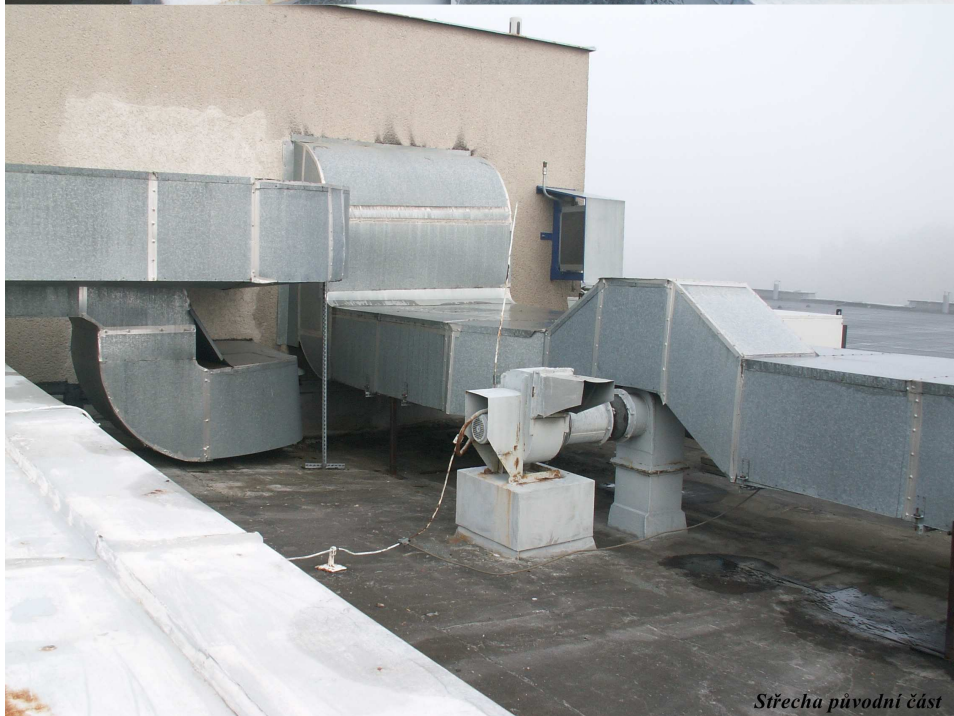
Střecha původní část