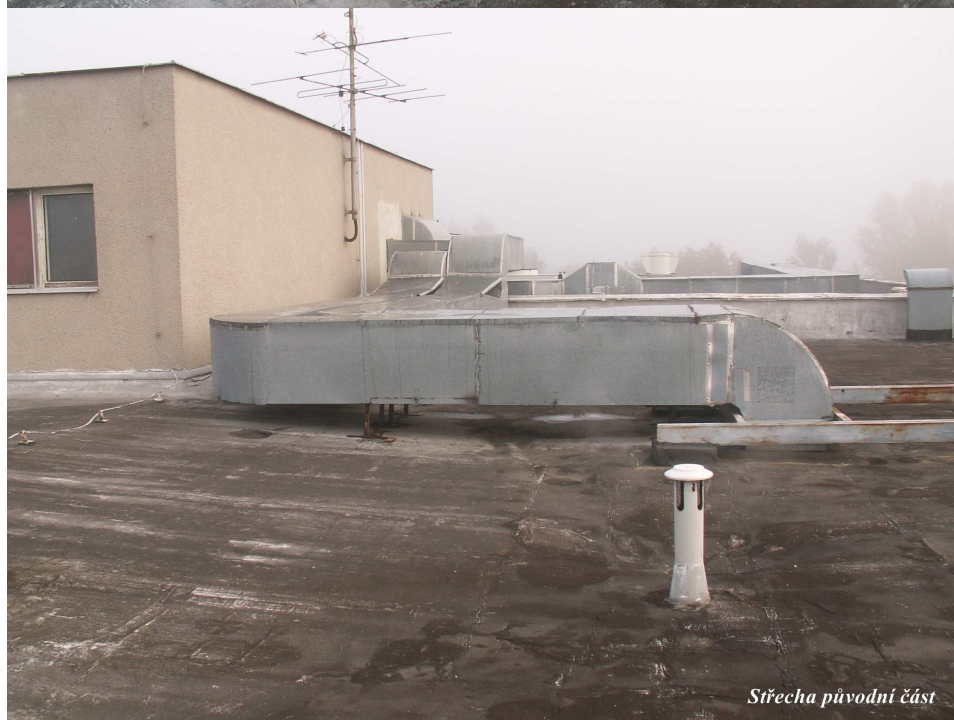
Střecha původní část