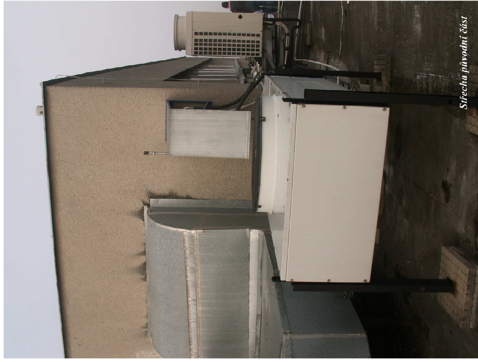
Střešní proudná část