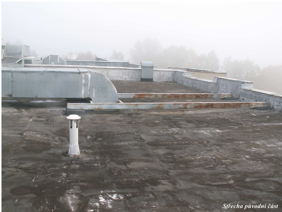
Střecha původní část