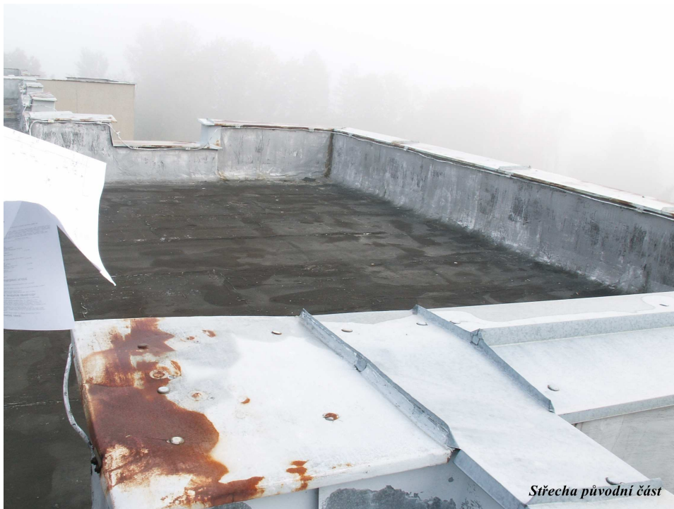
Střecha původní část