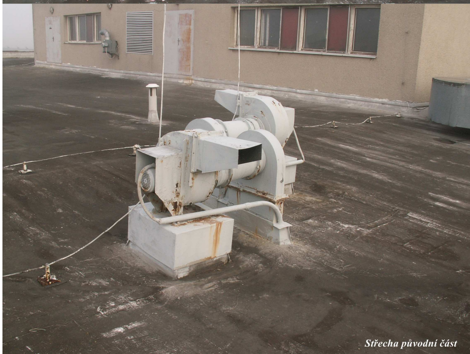
Střecha původní část